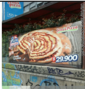
Publicidad en Vidrios